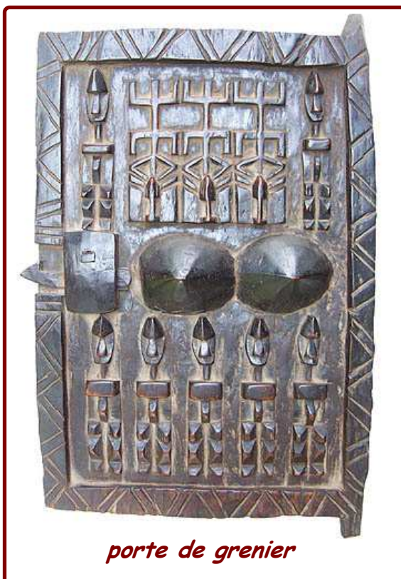
porte de grenier

Au ciel, les grands ancêtres tombèrent en désaccord à cause du Pô , ce fut la rupture de parole ; le Nommo décida alors d'envoyer sur la terre l'Ancêtre forgeron conduisant le long d'un arc-en-ciel un grenier (arche) qui contenait des exemplaires de tous les êtres vivants, des minéraux, des techniques, des institutions.