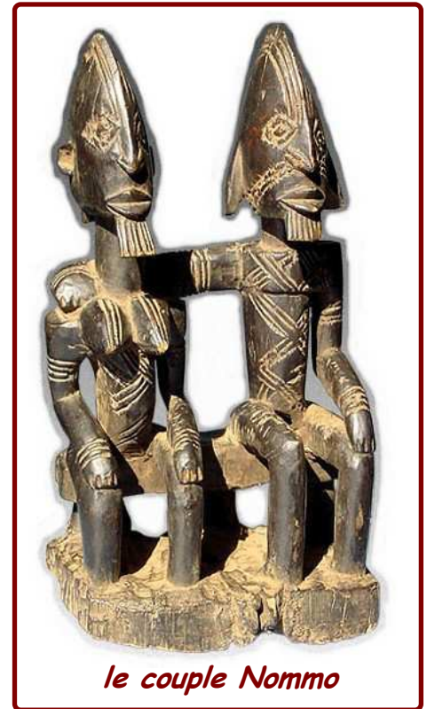
le couple Nommo