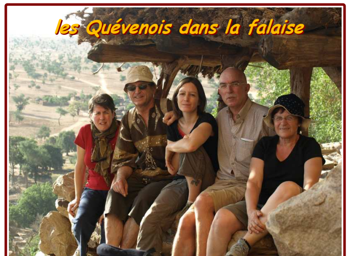
les Quévenois dans la falaise

Les repas, succulents, souvent opulents, mon malaise lorsque je n'arrivais pas à les finir ; les échanges avec nos hôtes sur nos différences culturelles toujours passionnants, les sucreries à l'ananas et le thé, surtout le premier des trois ! Mais je souhaiterais surtout terminer cette liste non exhaustive de mes souvenirs par l'admiration que je porte à ces femmes qui, malgré la pénibilité de leurs tâches quotidiennes gardent en elles cette joie de vivre, cette dignité, cette prestance, cette envie de s'organiser, d'avancer..."